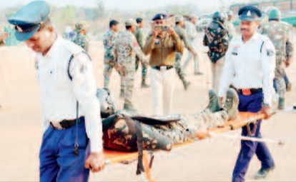
संचार प्रणाली की सक्रियता। प्रशिक्षण को केवल मैदान तक सीमित न रखकर इसे इंटरएक्टिव बनाया गया। प्रोजेक्टर के माध्यम से जवानों को पूर्व में घंटित घटनाओं के वीडियो और फोटोग्राफ्स दिखाए गए। वरिष्ठ अधिकारियों ने अपने अनुभव साझा करते हुए जवानों को सिखाया कि कठिन परिस्थितियों में धैर्य बनाए रखते हुए त्वरित निर्णय कैसे लिए जाते हैं। पुलिस प्रशासन ने स्पष्ट किया है कि यह प्रशिक्षण केवल जिला मुख्यालय तक सीमित नहीं रहेगा। आगामी दो महीनों के भीतर पूरे कांकेर जिले के विभिन्न थाना क्षेत्रों में इस प्रकार के अभ्यास सत्र आयोजित किए जाएंगे ताकि जिले का प्रत्येक जवान किसी भी अप्रत्याशित स्थिति के लिए तैयार रहे।